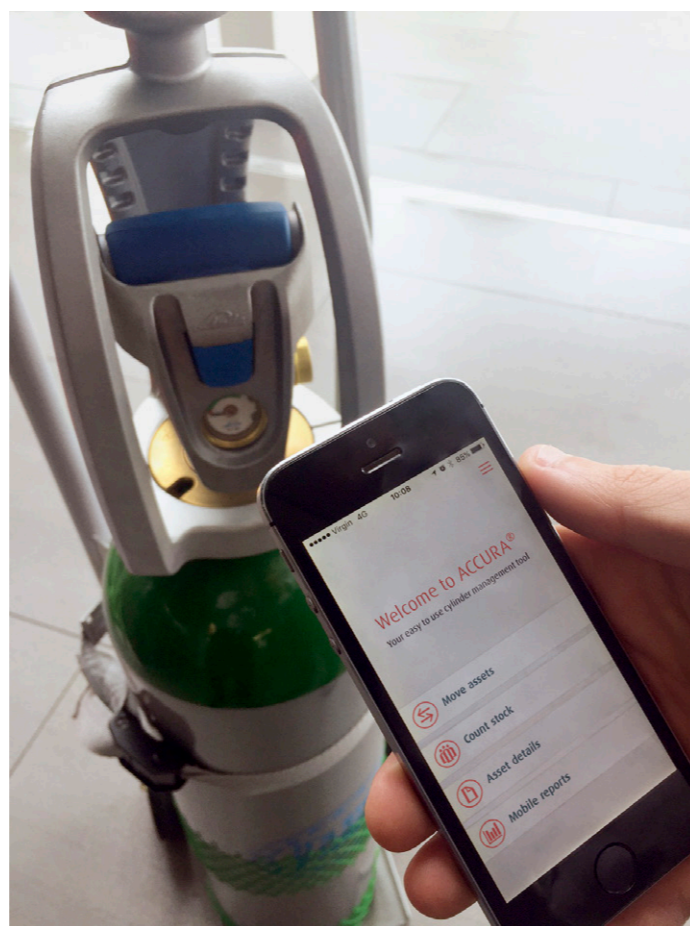
Aplikacja na smartfony umożliwia odczytywanie przy pomocy aparatu fotograficznego kodów kreskowych umieszczonych na butlach, a także automatyczną aktualizację danych systemu na wszystkich urządzeniach.